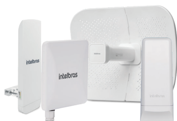
Rádios banda larga outdoor