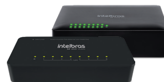
Família de switches SF 800 e SF 1600