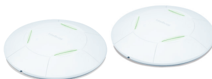
Access points corporativos