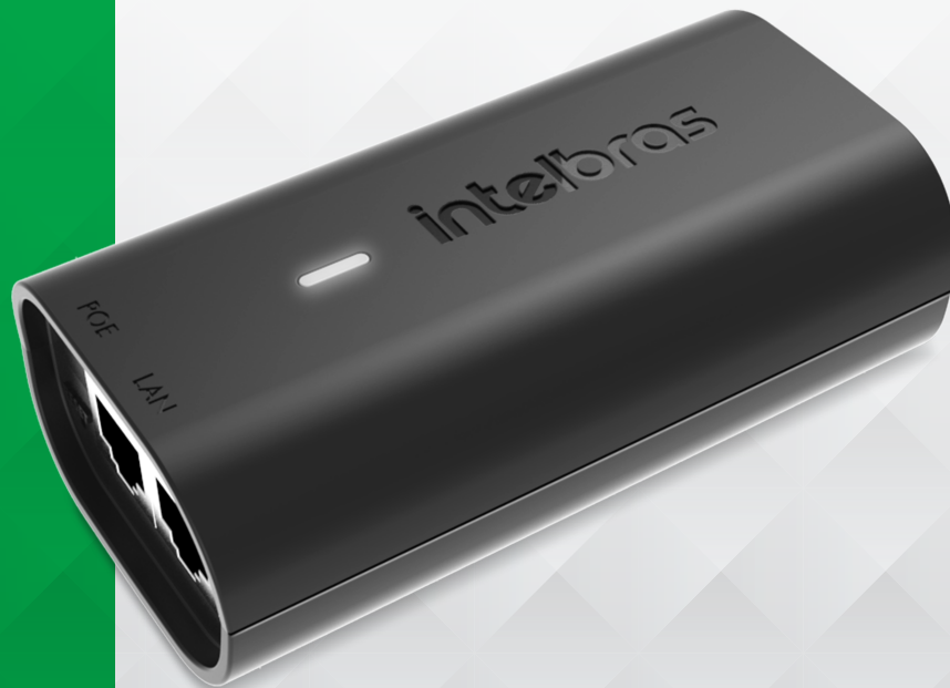
Fonte injetora PoE passivo